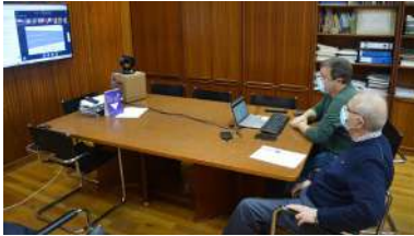
A xuntanza levouse a cabo a través de Campus Remoto