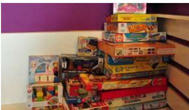
Os xoguetes poden entregarse ata o vindeiro 14 de decembro

O proxecto Sherpa do Mar, liderado polo grupo de investigación REDE, ten como obxectivo dinamizar a creación e consolidación de novas actividades empresariais intensivas en coñecemento no ámbito mariño-marítimo na eurrrexión Galicia e norte de Portugal. Para logralo acaba de poñer en marcha unha nova iniciativa , que permitirá ás empresas deste eido coñecer a súa posición competitiva fronte a outras entidades do sector, ademais de avaliar as súas capacidades e necesidades en materia de I+D+i. +info.