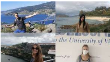
Nestes intres a Universidade de Vigo ten matriculados 237 alumnos e alumnas internacionais

14 vídeos curtos nos que investigadoras e profesoras de catro centros do campus de Ourense explican de xeito divulgativo a traxectoria e relevancia de 14 mulleres referentes no campo da ciencia, a tecnoloxía e as enxeñarías. Así se presenta a exposición virtual Exxperimenta en feminino , iniciativa que, ao igual que o proxecto no que se enmarca, ten como obxectivo último espertar en rapaces e rapazas a vocación científica suplindo a carencia de referentes femininos nestes campos. +info .