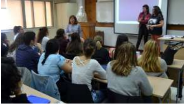
Un intre da anterior edición desta iniciativa