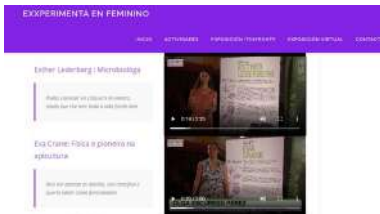
Captura da páxina web onde están dispoñibles os vídeos da mostra

Formar ao alumnado da Escola Universitaria de Enfermaría de Pontevedra, centro adscrito á Universidade de Vigo, na importancia de contribuír á ruptura de estereotipos e prexuízos de xénero, así como achegarlles información sobre igualdade de oportunidades, discriminación e violencia de xénero e proporcionarlles coñecementos e ferramentas para facilitar a reflexión autocrítica e promover actitudes feministas. Estes son os obxectivos do Módulo de sensibilización en igualdade de oportunidades entre mulleres e homes e perspectiva de xénero, que a escola acolle mañá, martes 17, e o 1 de decembro. +info .