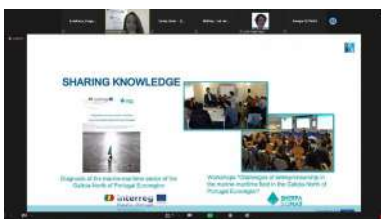
Presentación de Sherpa do Mar onte luns no workshop 'Towards a pact for skills in the maritime technology industry'

Colaboración para o desenvolvemento de proxectos de investigación; organización e realización de actividades académicas como cursos, conferencias ou seminarios; apoio a investigadores e estudantes; intercambio de publicacións, traballos de investigación e outros materiais académicos; colaboración en proxectos culturais ou mobilidade de estudantes e persoal docente, así como promoción da igualdade de oportunidades entre mulleres e homes en todos os ámbitos da sociedade. +info .