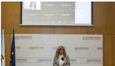
O reitor e a presidenta da Deputación presentaron este luns a páxina

Preto de 80 accións integran o sexto plan de acción do programa Green Campus, proxecto que permitiu a Pontevedra converterse en 2015 no primeiro campus de España en obter a bandeira verde que outorga a Foundation for Environmental Education (FEE). Diferentes medidas en materia de optimización dos consumos enerxéticos, redución de residuos, consumo responsable, voluntariado ambiental e sustentabilidade integran a folla de ruta do programa para o presente curso. +info .