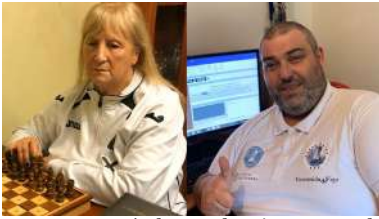
Lago e Fernández son dous integrantes da selección española neste torneo