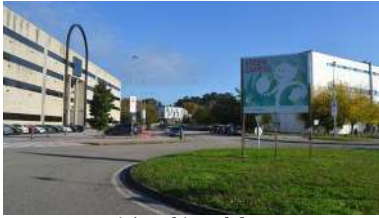
O Comité Ambiental do Green Campus definiu o seu sexto plan de acción