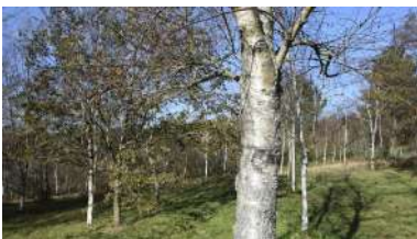
A Ruta da Cima conta coas zonas das mámoas, da devesa e do estanque como puntos principais

Nun contexto caracterizado polas limitacións de mobilidade, a Área de Benestar, Saúde e Deporte acaba de lanzar unha iniciativa para animar á comunidade universitaria a camiñar polo campus de Vigo seguindo un itinerario que conta coas zonas das mámoas, da devesa e do estanque como puntos principais. A chamada Ruta da Cima está ideada para que calquera persoa poida realizala e ten unha duración máxima de vinte minutos. +info .