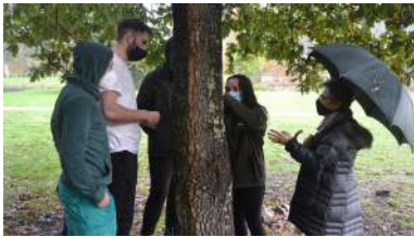
O taller sobre liques levou ao alumnado ata a illa do Covo