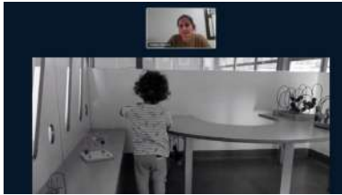
Durante a súa intervención percorreu os diferentes espazos dunha escola infantil