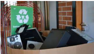
Punto de recollida de CCSS e da Comunicación