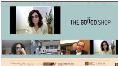
Sete emprendedores e emprendedoras defenderon os seus proxectos diante do xurado