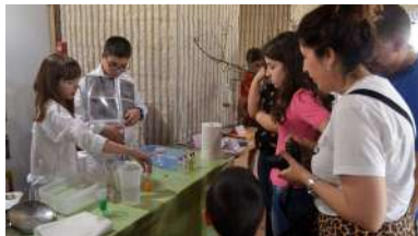
A crise sanitaria impide neste 2020 a celebración da Feira da Miniciencia