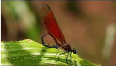
O obxectivo da rede é poder estimar a abundancia das poboacións. Na imaxe, exemplar 'Euphaea ornata'