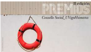
O prazo para presentar candidaturas manterase aberto ata o 16 de novembro