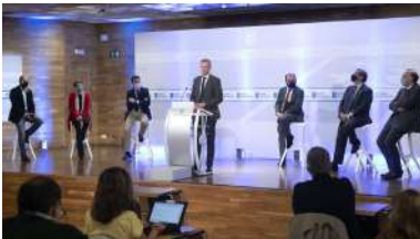
Un intre da presentación de hoxe en Santiago