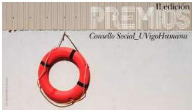
Os premios entregáranse o 18 de decembro