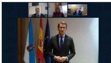
Na inauguración proxectouse un vídeo de saúdo do presidente da Xunta

A crise sanitaria obrigou neste 2020 a reconvertir Pontenciencia nunha semana de actividades de divulgación científica nas que participarán alumnos e alumnas de dez centros de ensino de Pontevedra. As restricións ás que obriga a covid-19 impiden o desenvolvemento da feira de expositiva na que cada ano se presentaban na Escola de Enxeñaría Forestal os proxectos e experimentos desenvolvidos polo alumnado dos diferentes centros participantes, reconverténdoa nunha semana de actividades ás que asistiran grupos reducidos de estudantes. +info .